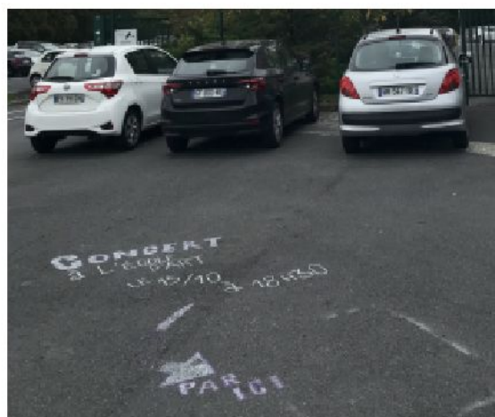
Signalétique sur le sol du campus universitaire de Cambrai qui annonce le concert de Hermetic Delight le 15 octobre 2025.