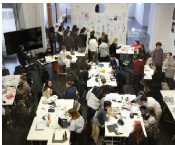
Workshop de dessins de presse, animé par l'association Dessinez Créez Liberté; organisé à l'Esac et associant des étudiant-es de l'UPHF (techniques de communication) les 25/26 février 2025.